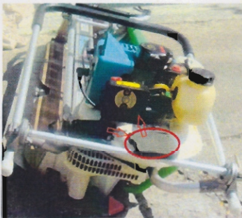
एयर फिल्टर की सफाई Air filter cleaning