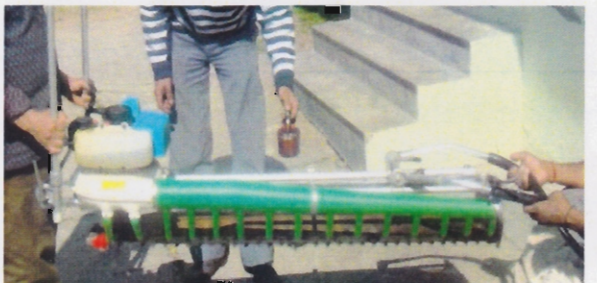
ब्लेड में तेल लगाना Oiling of blades