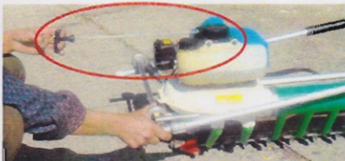
ईंजन चलाना Engine starting

इंजन बहुत ज्यादा गति से घूमेगा और इससे मशीन को क्षति पहुंचेगी