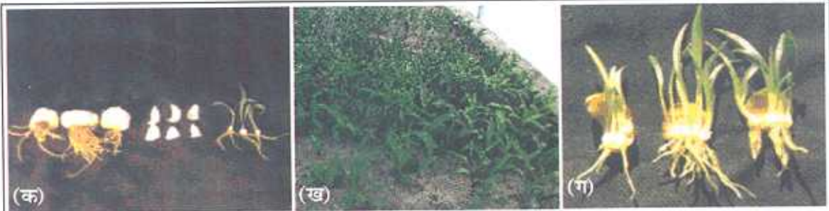
(क) मातृ कंद, स्केल्स एवं स्केल्स से उत्पादित छोटे कंद (ख) प्रोपेगेशन चैम्बर में बालू में स्केल्स से उत्पादित पौधे (ग) बालू में स्केल्स रोपण करने के दो माह पश्चात स्केल्स को निकालने के उपरान्त एक दृश्य