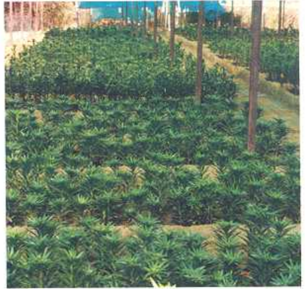
बड़े कन्दों से पुष्प उत्पादन की प्रारम्भिक अवस्था