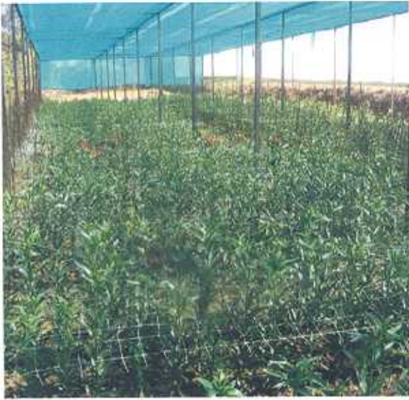
छोटे कन्दों से बड़े कन्दों का उत्पादन