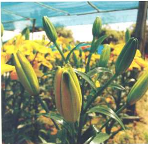
कटाई के लिए उचित अवस्था पर एशियाटिक लिली का पुष्प