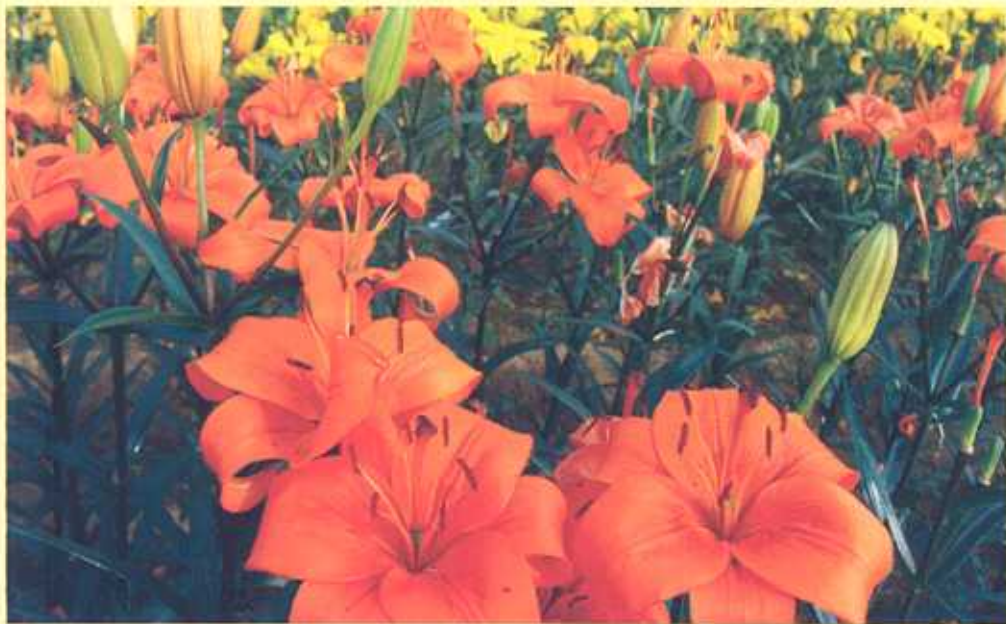
एशियाटिक लिली पुष्प उत्पादन का दृश्य