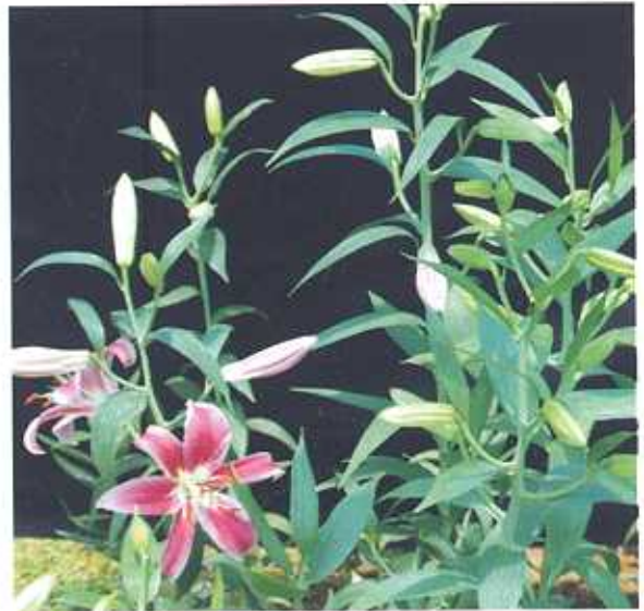
कटाई के लिए उचित अवस्था पर ओरिएन्टल लिली का पुष्प