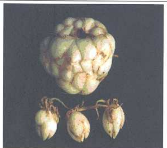
छोटे कन्द एवं बड़ा कन्द