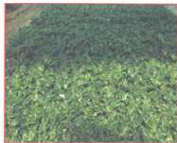
जड़ फुटाव हेतु बालू में रोपित कलमों