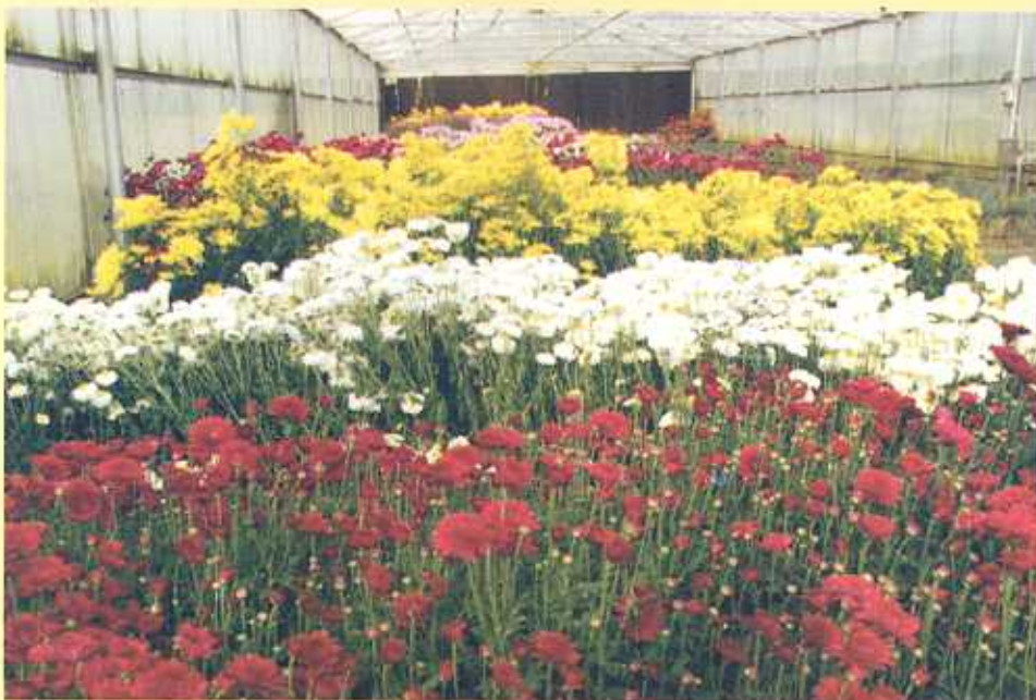
स्रे टाईप गुलदाऊदी का ग्रीनहाउस में पुष्पोत्पादन