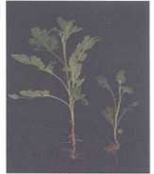
मूलस्तरी विधि से तैयार पौधे