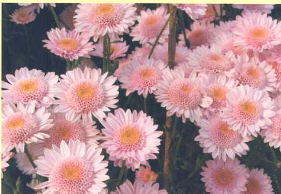
स्रे टाईप गुलदाऊदी की किस्म मुण्डियाल का पुष्प