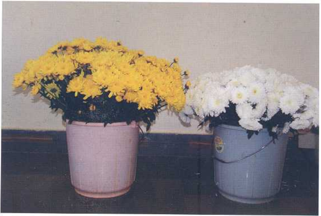
स्टैण्डर्ड टाईप गुलदाऊदी का कर्तित पुष्प