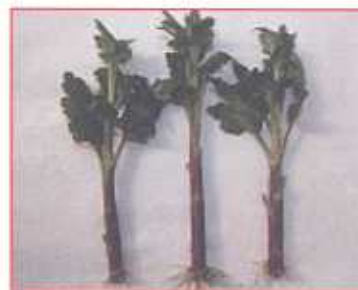
रोपण के लिए तैयार कलमों