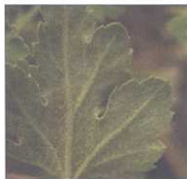
लाल मकड़ी से प्रभावित पत्ती

यह छोटी आकृति का कीट सामान्यतः सिंदुरी लाल रंग का होता है तथा पत्तियों के पृष्ठ भाग पर पाया जाता है। इसका अत्यधिक प्रकोप होने पर यह सम्पूर्ण पौधों पर जाला बना लेता है। लाल मकड़ी पत्तियों से रस चूसते हैं। इसके चूसने के उपरान्त पत्तियों का हरा रंग भूरे रंग में परिवर्तित होने लगता है तथा यह पुष्प कलियों को भी नुकसान पहुँचाता है। लाल मकड़ी का प्रकोप वातावरण में आर्द्रता की कमी होने पर इसके पौधों पर ज्यादातर देखा गया है। इसकी रोकथाम के लिए वातावरण में कृत्रिम रूप से आर्द्रता बढ़ानी चाहिए तथा ओमाईट (प्रोपारजाईट) नामक मकड़ी नाशक दवा का 0.03 प्रतिशत का घोल या हिलफोल/डाईकोफोल 1.0-1.5 मिली. प्रति लीटर पानी में घोल कर पौधों पर छिड़काव करना चाहिए।