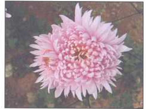
टाटा सेन्चुरी किस्म का पूर्ण विकसित पुष्प

पुष्प डण्डियों को काटने की उचित अवस्था, किस्मों, संभावित पुष्प बाजार से दूरी तथा ट्रांसपोर्टेशन की सुविधा पर निर्भर करता है। स्टैण्डर्ड गुलदाऊदी की किस्मों के फूल तभी काटने चाहिए जब पुष्प पूर्ण रूप से खिल जायें और बाह्य पंखुड़ियाँ पूरी तरह से सीधी हो जाएं। स्प्रे गुलदाऊदी की किस्मों को उस समय काटना चाहिए जब पुष्प डण्डी पर ऊपरी एक पुष्प पूर्ण रूप से खिल जाए एवं अन्य पुष्प कलियों में रंग दिखने लगे। पुष्प टहनी को जमीन से लगभग 10-12 सेंमी. की ऊँचाई पर काटना चाहिए। पुष्प डण्डियों को काटने का कार्य सुबह या सायंकाल के समय करनी चाहिए। पुष्प डण्डियों को काटने के तुरन्त बाद इसका निचला 5-6 सेंमी. हिस्सा साफ पानी में डुबा देना चाहिए तथा किसी ठण्डे कमरे या छायादार स्थान पर 3-4 घण्टे के लिए रख देना चाहिए।