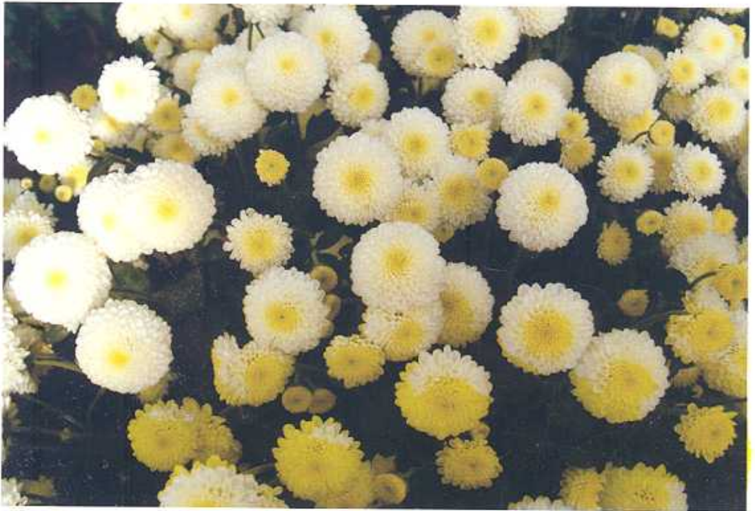
मम टाईप गुलदाऊदी