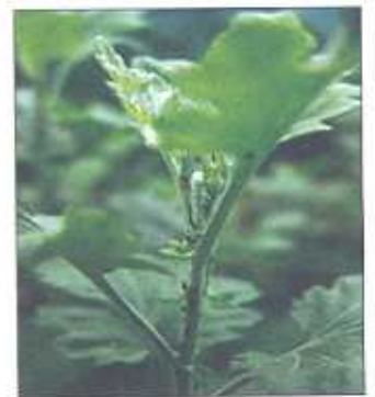
एफिड से प्रभावित पौधा

गुलदाऊदी को प्रभावित करने वाला एफिड सामान्य एफिड से थोड़ा बड़े आकार का काले भूरे रंग का होता है जो पौधों की नई शाखाओं, पत्तियों के पृष्ठ भाग एवं कलियों पर पाये जाते हैं तथा इसका रस चूसते रहते हैं। अत्यधिक रस चूस लेने के कारण क्लोरोफिल की कमी से पत्तियाँ पीली पड़ने लगती हैं तथा पौधों की पूर्ण वृद्धि की गति धीमी पड़ जाती है। एफिड का अत्यधिक प्रकोप होने पर पुष्प कलियों का आकार छोटा हो जाता है एवं पूर्ण रूप से खिल नहीं पाती हैं। एफिड विषाणु रोग को एक पौध से दूसरे पौधों पर फैलाने का कार्य भी करता है। इसके प्रकोप से बचने के लिए पुष्प उत्पादक को पॉलीहाउस के आस-पास खरपतवार उगने नहीं देना चाहिए। गुलदाऊदी के पौधों पर एफिड का प्रकोप होने पर मैलाथ्रियान या इण्डोसल्फान 1.5-2.0 मिली. प्रति लीटर पानी में घोलकर सम्पूर्ण पौधों पर अच्छी तरह से छिड़काव करनी चाहिए।